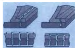
Con coltellino sopra Fudging

Cucitrice rapidissima a due fili per scarpe, soles e tomaie (lavorazione Goodyear, Ideal, California e San Crispino)