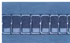
Posizionatura del nodo costante constant Lock Positioning